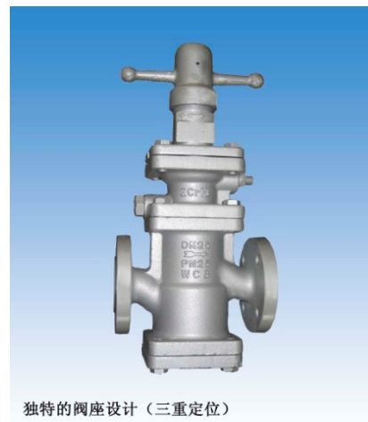
独特的阀座设计 (三重定位)